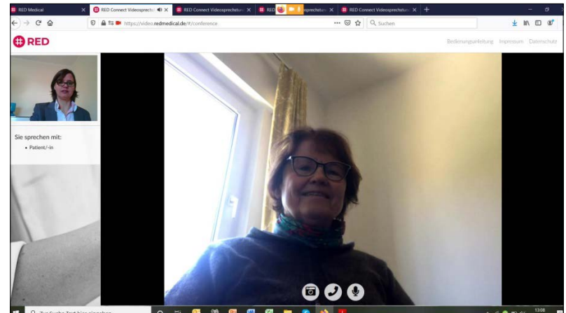
Hier ein typisches Beispiel für eine schlechte Ausleuchtung und Gegenlicht